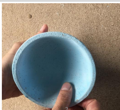
4: Bläschen mit den Finger glattstreichen