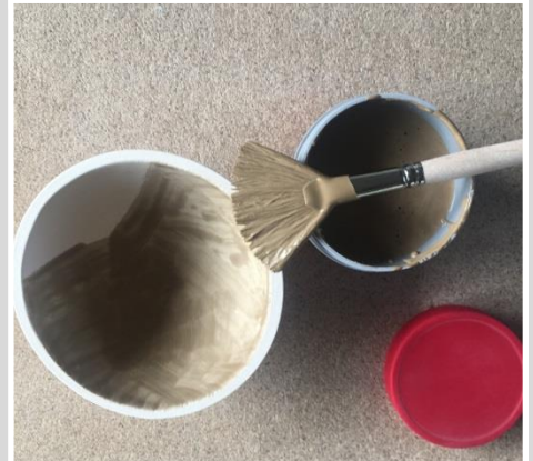
1: Drei Schichten von Glasur Cognac auftragen