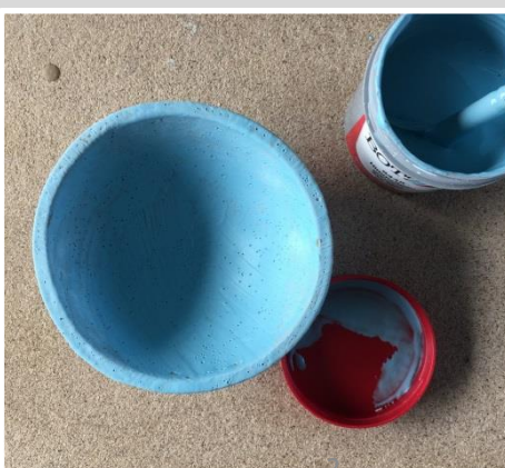
3: Zwei Schichten bunte Glasur, hier: Himmelblau