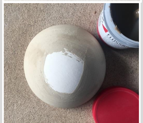
2: Standfläche frei lassen